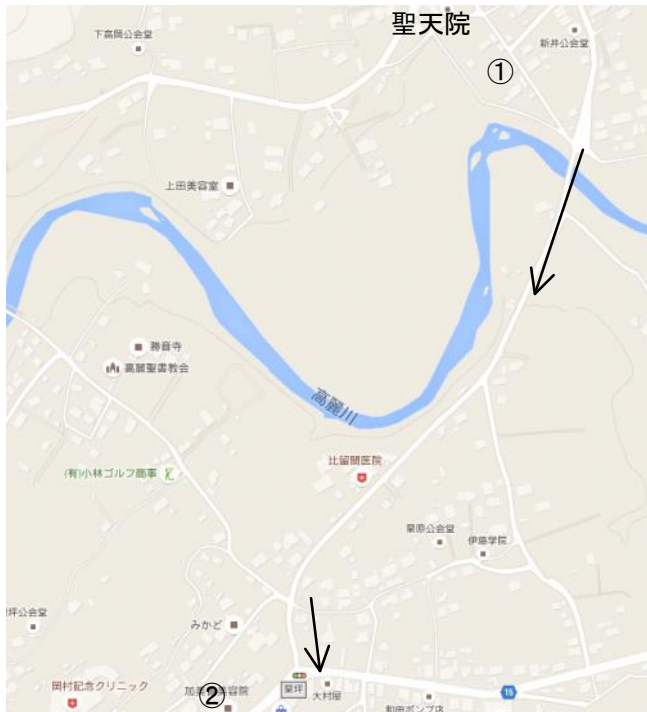
栗坪の突き当りを右折