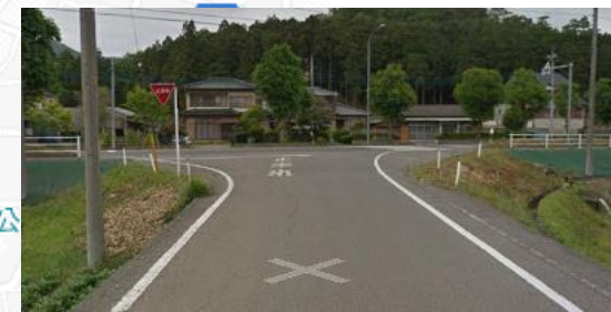
2車線 止まれ 右折