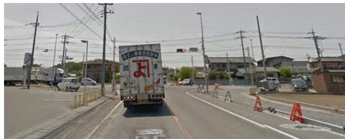
②すぐの交差点左折