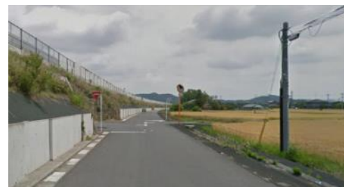
⑤変形十字路左折 北関東自動車道下 をくぐる