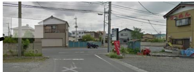
③4車線道路突当り右折