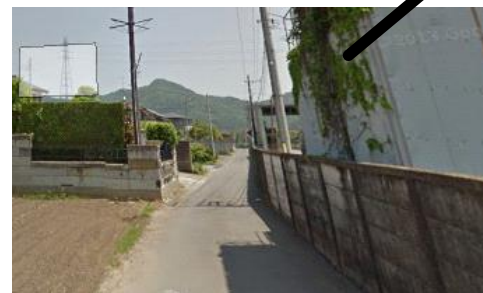
踏切渡って真っ直ぐ