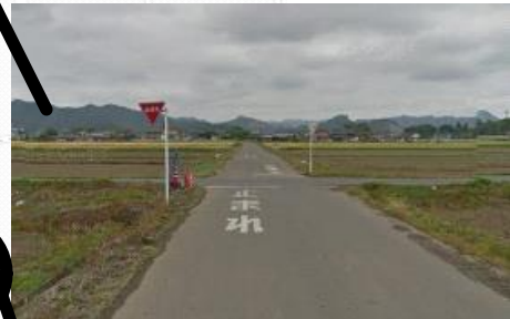
⑥交差3本目 止まれ左折