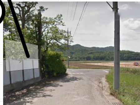
⑤すぐの変形交差点を右折