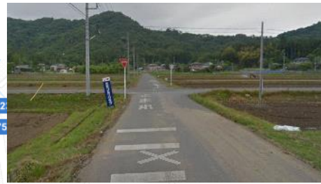
⑦橋渡って 止まれ 右折