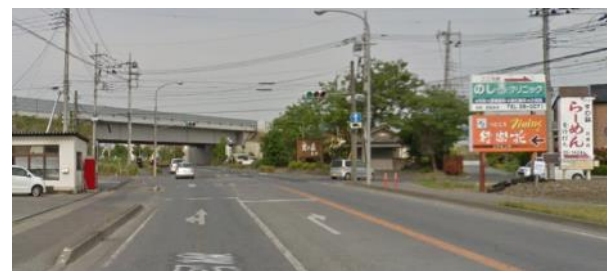
③北関東自動車道手前の交差点右折