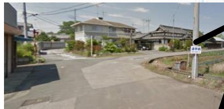
②止まれの方に真っ直ぐ