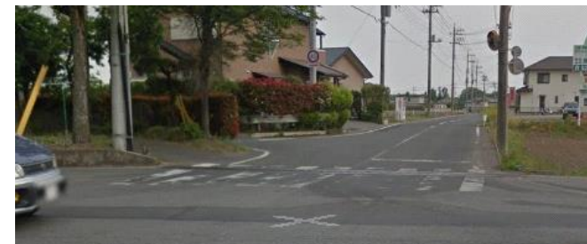
④右折してすぐを左折