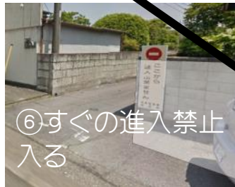
⑥すぐの進入禁止 入る