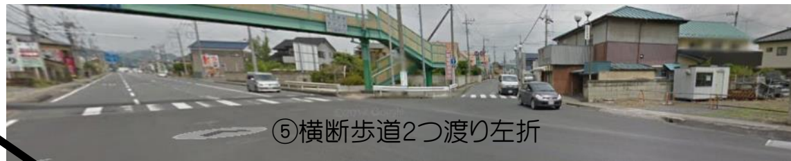
⑤横断歩道2つ渡り左折